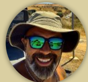
Pedro Alves (Comediante; MonstTter)